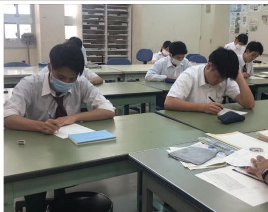
モールス信号の送信および、聞き取りの技術を身につける「電気通信術」。

無線従事者国家試験において、科目「無線工学 A・B」、「法規」、「電気通信術」に該当する領域を、「専門科目」として履修します。