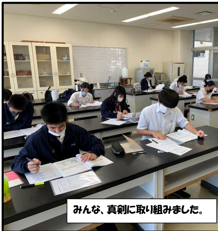
みんな、真剣に取り組みました。