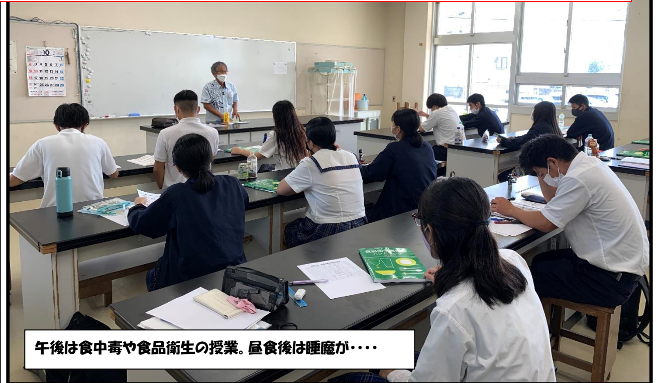
午後は食中毒や食品衛生の授業。昼食後は睡魔が・・・