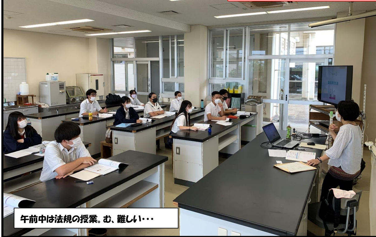
午前中は法規の授業。む、難しい・・・

食品衛生責任者とは食品の製造・販売を行う場合に必要な国家資格です。県内高校では本校総合学科食品科学系列と一部の農林高校でしか取得できません。10/13(木)、食品科学系列の3年生、14名がその資格取得に挑戦しました。丸一日、6時間の講座を受け、その後の確認試験を終え全員が合格しました！普段、授業では眠そうにしている一部の生徒もこの日ばかりは目を見開き、頑張っている姿が印象的でした。皆さん、「食品衛生責任者」合格おめでとうございます！！