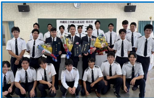
④専攻科：Ⅱ類卒業式の集合写真