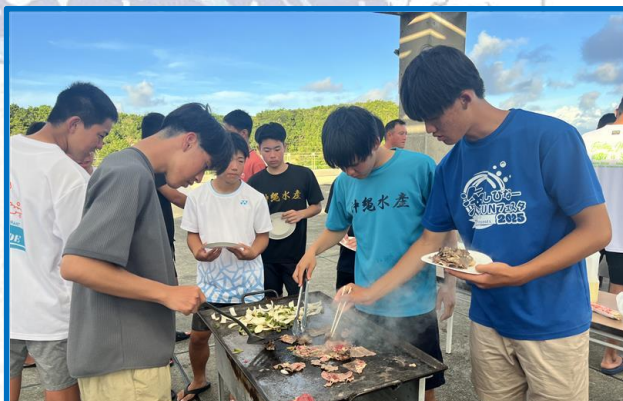
②1年：宿泊学習での親睦バーベキュー