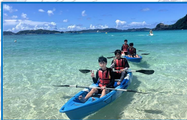
①1年：渡嘉敷島でマリンレジャー体験