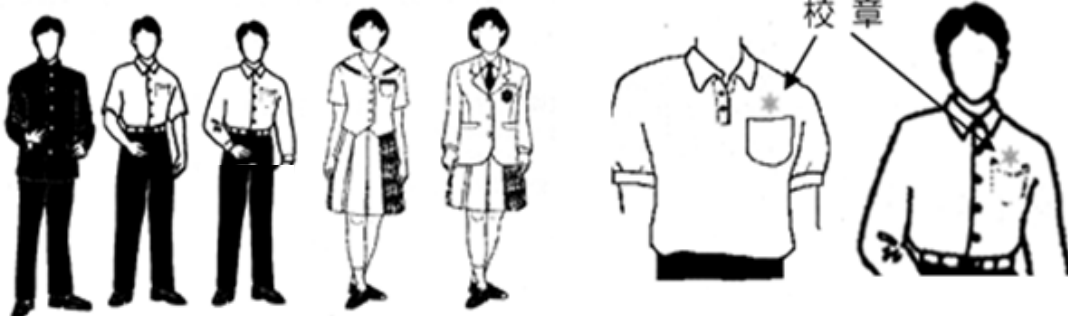
図1 ズボンスタイル

*スカートの丈は、立位で膝頭が隠れる程度の長さとする。 *ワイシャツは長袖または半袖とする。