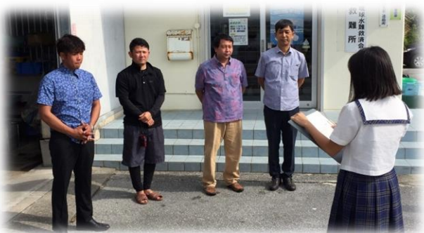
↑生徒代表のお礼の言葉