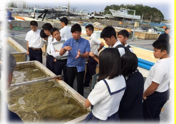
↑網にもずく種苗の定着作業