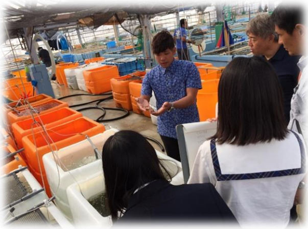
↑海ぶどう養殖の説明②