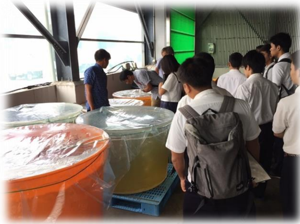
↑もずく種苗の説明中！