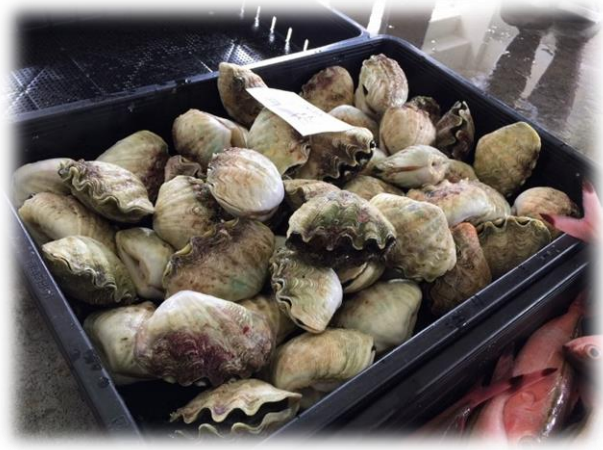
↑競りの様子をチェック